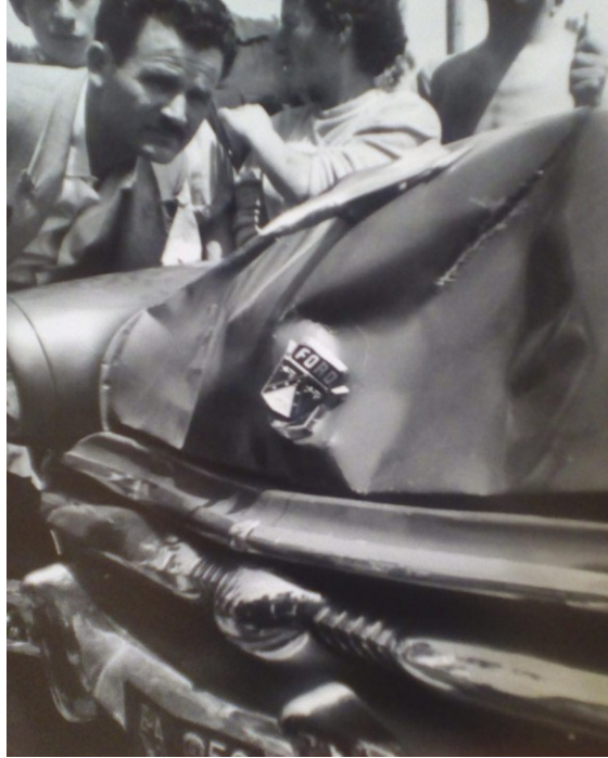
Η αμερικανική Μπουϊκ, με εμφανή τα σημάδια από την πρόσκρουση στα σώματα του ζεύγους Σαράφη

Λίγους μήνες μετά, δέχεται τη δολοφονική επίθεση και πέφτει νεκρός