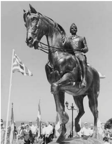
Το άγαλμα του Στέφανου Σαράφη στη Λεωφόρο Βουλιαγμένης

Το εθνικό αίσθημα αξιώνει την άμεση κατάργηση του ατιμωτικού αυτού καθεστώτος» 6 .