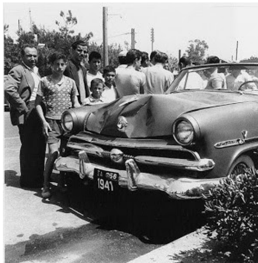
Λίγο μετά την ολοκλήρωση του στρατηγού του Ε.Α.Α.Σ. Στέφανου Σαράφη, Άλιμος 1958.

Ευτυχώς, είμαι ενθουσιασμένος ότι βρήκα εκείνη την οργάνωση που ανταποκρίνεται απόλυτα στις απαιτήσεις μου, για ένα αποφασιστικό πόλεμο κατά των Γερμανών. Αποφάσισα λοιπόν να τους προτείνω να με δεχτούν, έστω και σαν απλό στρατιώτη, να πολεμήσω μαζί τους. Αν δε με δεχτούν, τότε μου απομένει να γυρίσω στην Αθήνα και να δω τι θα κάνω.